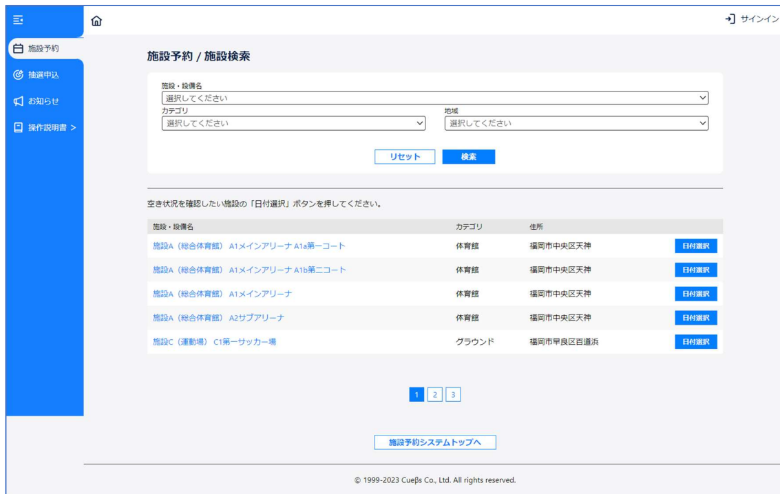
図 2 : 施設検索画面