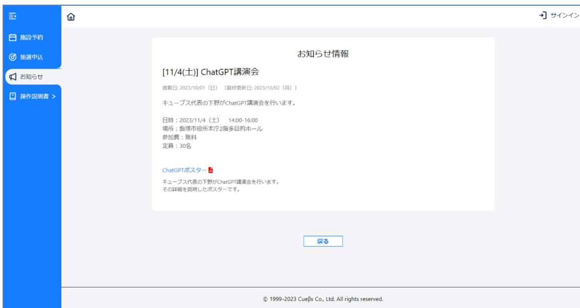
図 7 : お知らせ詳細画面