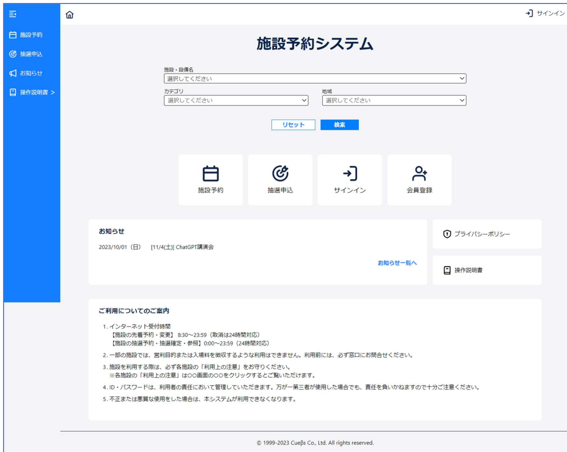
図 1 : ダッシュボード