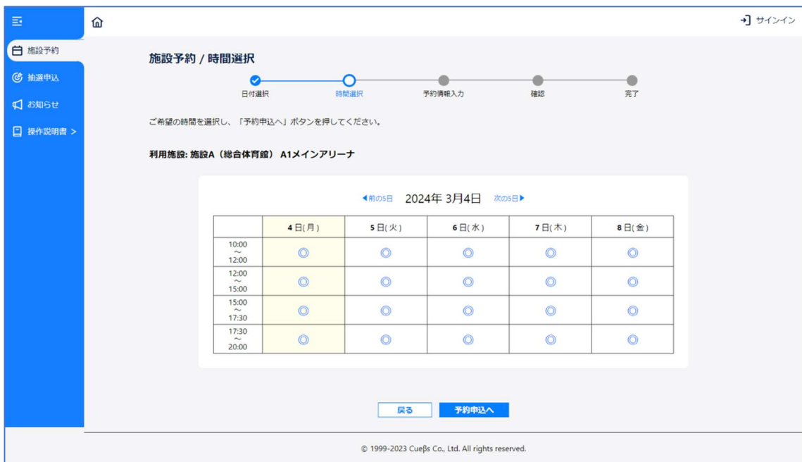
図 4 : 時間選択画面