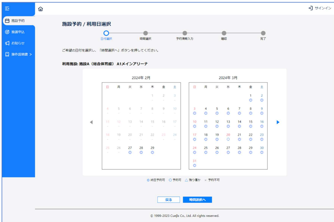
図 3 : 利用日選択画面